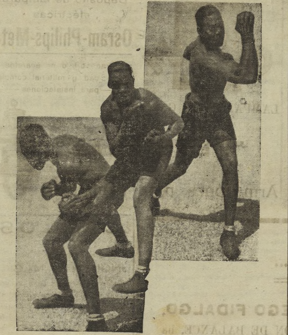
El medio mediano Joe Roly, campeón cubano, que está conquistando unas concluyentes victorias. Roly muestra en esta "foto" algunas de sus principales actitudes, que no están exentas de elegancia y perfecto conocimiento de la pose.

que dicen por acá, no me parece prudente enjuiciar por lo que de él llevamos visto en los dos combates de toda su historia, que en junto no completarían un solo round.