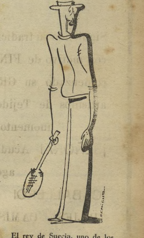
El rey de Suecia, uno de los más asiduos jugadores de tenis que a pesar de su avanzada edad puede competir con éxito frente a las mejores raquetas.