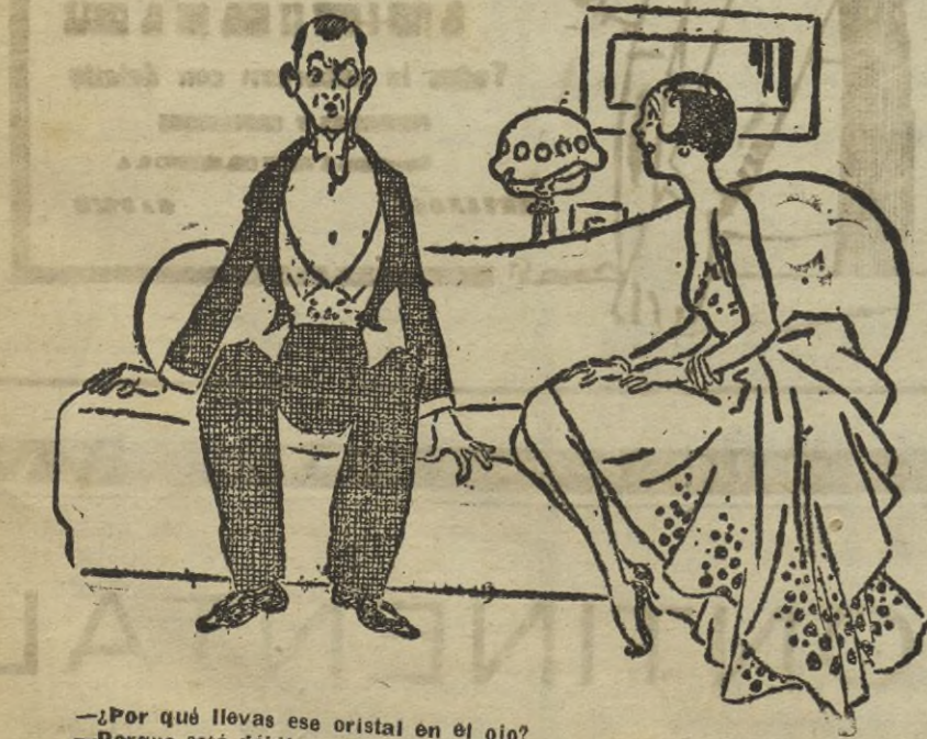
—¿Por qué llevas ese cristal en el ojo? —Porque está débil. —Entonces, ¿cómo es que no llevas sombrero de cristal?