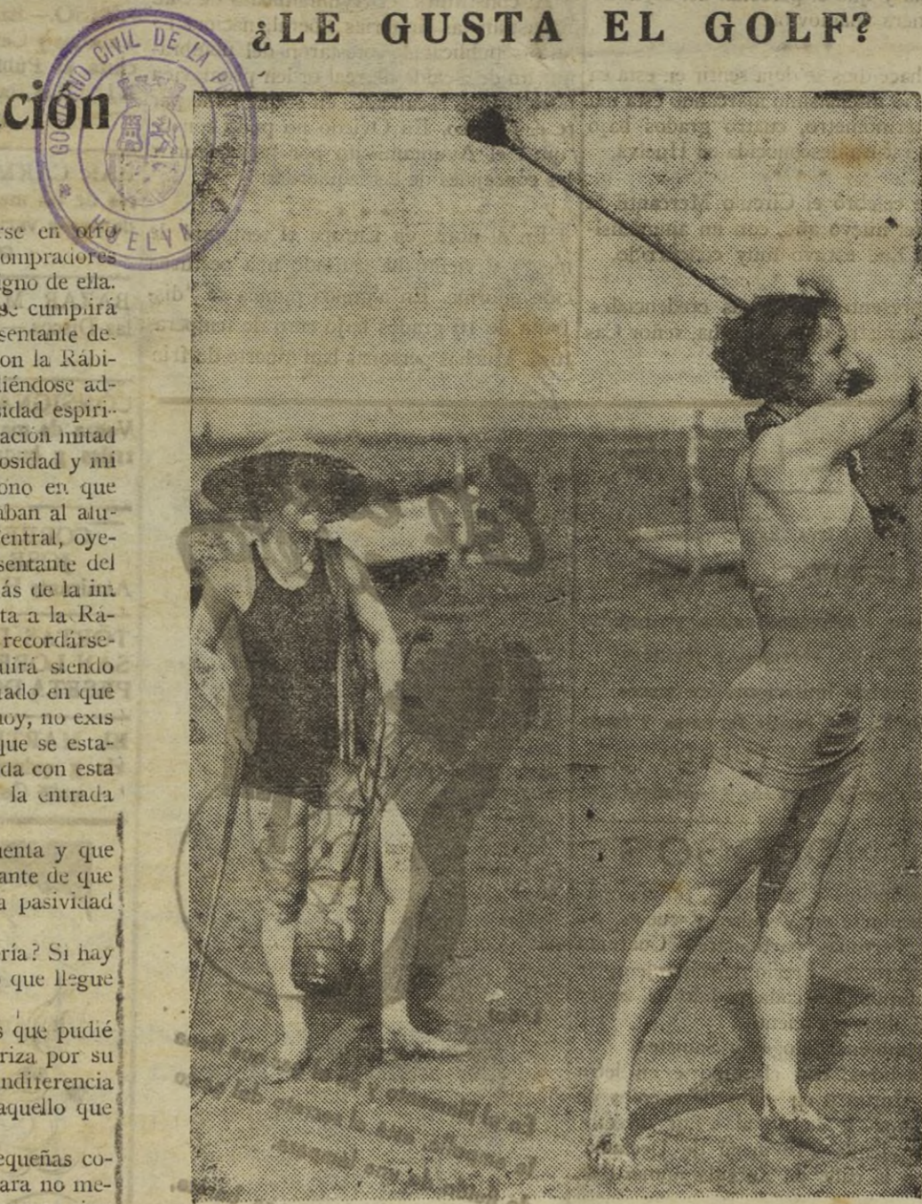
No podrá negarse que tiene sus atractivos el británico deporte. Conserva la línea, da flexibilidad, reconforta el ánimo... pero se necesita una buena maestra.

Hagamos bueno lo de Año Nuevo, vida nueva y que al final no nos encontremos con un balance tan pobre como el que hemos efectuado del año viejo.