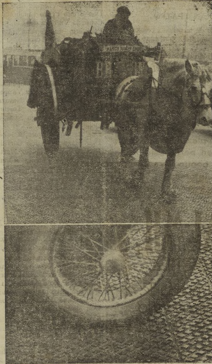
En París se están ensayando con resultados satisfactorios unos pavimentos metálicos cuya duración puede considerarse prácticamente ilimitada y que además vendrían a solucionar la crisis de la industria metalúrgica.