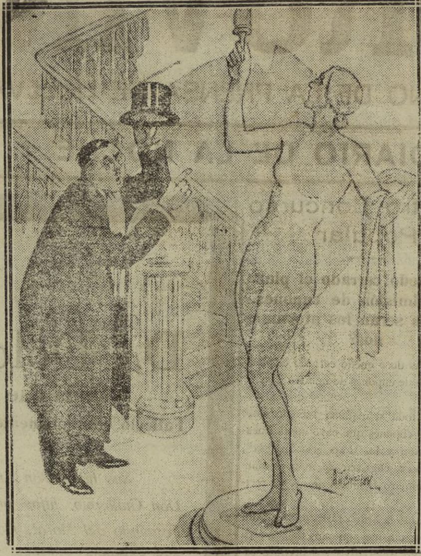
EL HUESPED QUE SE RETIRA TARDE: Si lo que usted busca, señora es el cuarto de baño, lo tiene usted en el piso de arriba.