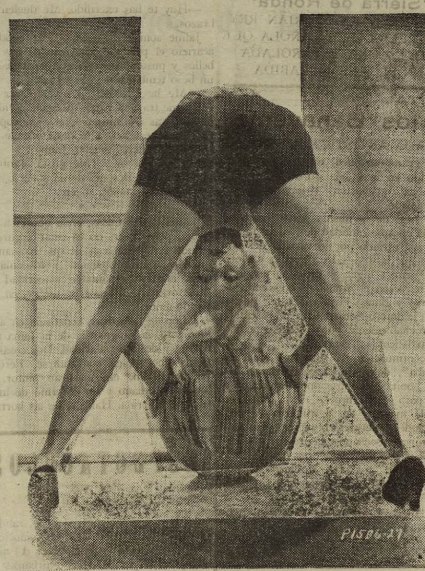
No ofrece duda que Toby Wing, la bella actriz del cinema, es sumamente original en el arte de posar fotográficamente para deleitar a sus admiradores los encantos de la gimnasia.

UNA LOTERIA SENSACIONAL ¡Sólo mil duros el billete!