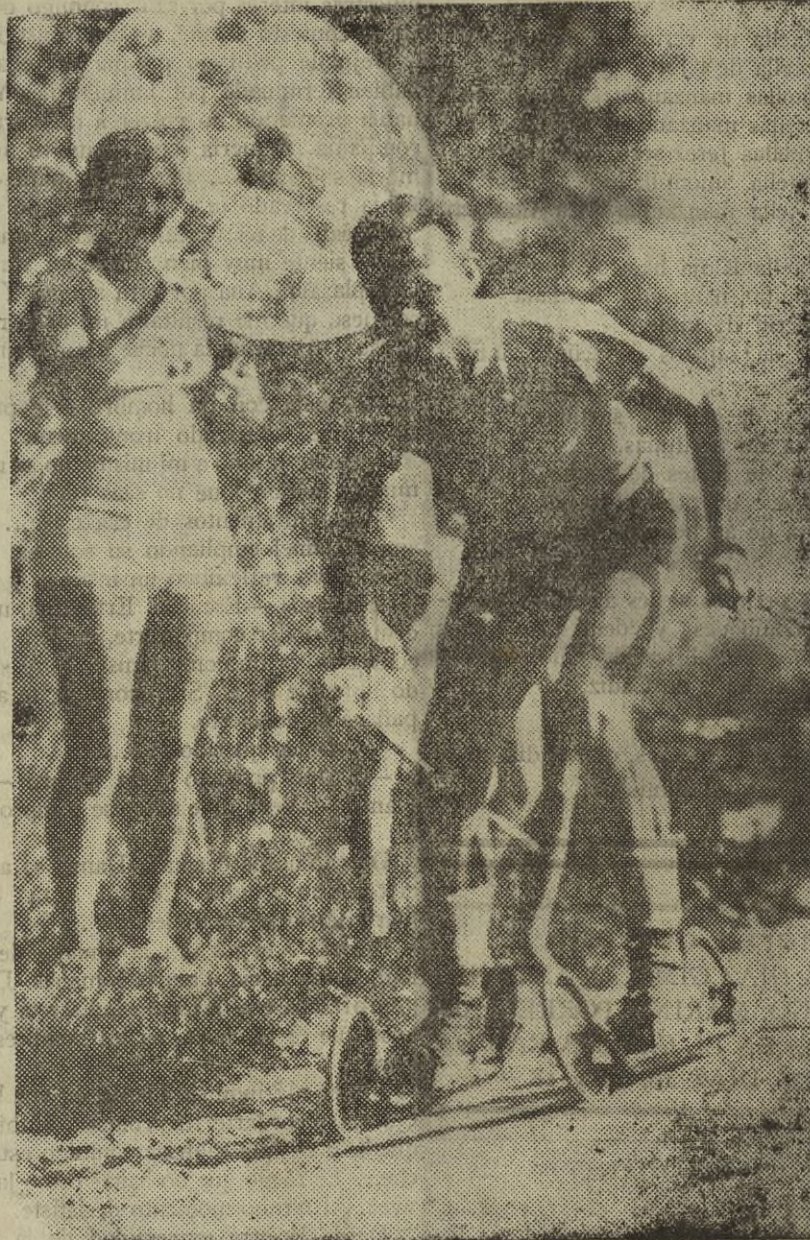
Esta familia entusiasta del deporte está ensayando un novísimo medio de transporte apropiado para peatonales veloces: un sistema de patines gigantes que permiten desarrollar considerables velocidades y que, seguramente, pronto conquistarán los honores de la popularidad.