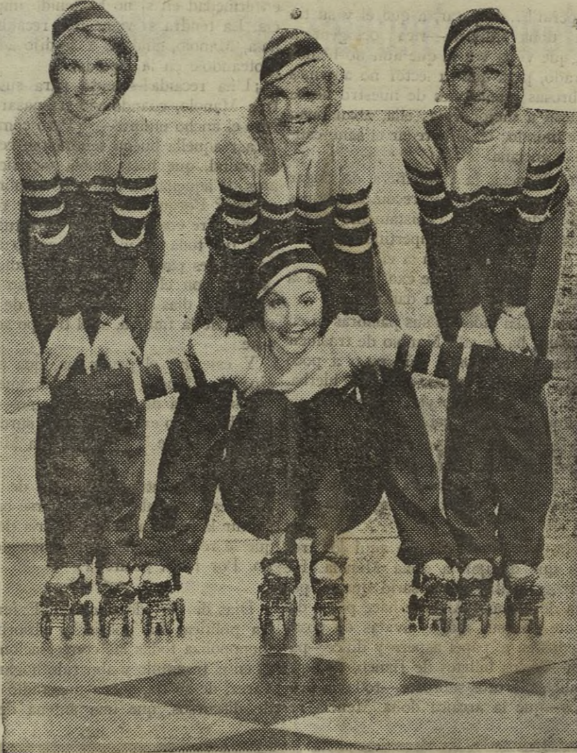
Cuatro bellas coristas ensayando un número de patinadoras para un film