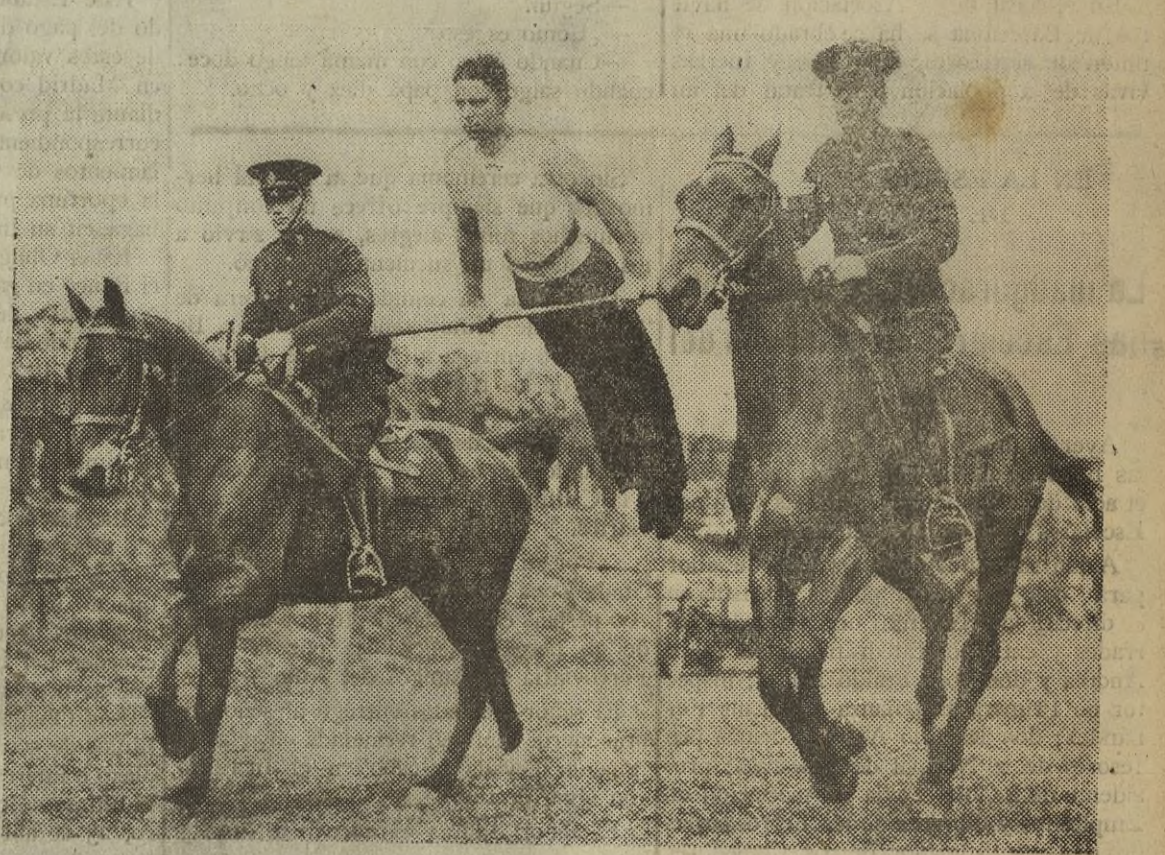
Este nuevo deporte hace furor entre los aficionados a la equitación. Se trata de ejercicios de barra realizados entre dos caballos al trote.

¿Para que sirve el cruce a nado del Canal de la Mancha y el record automovilístico de Malcolm Campbell?