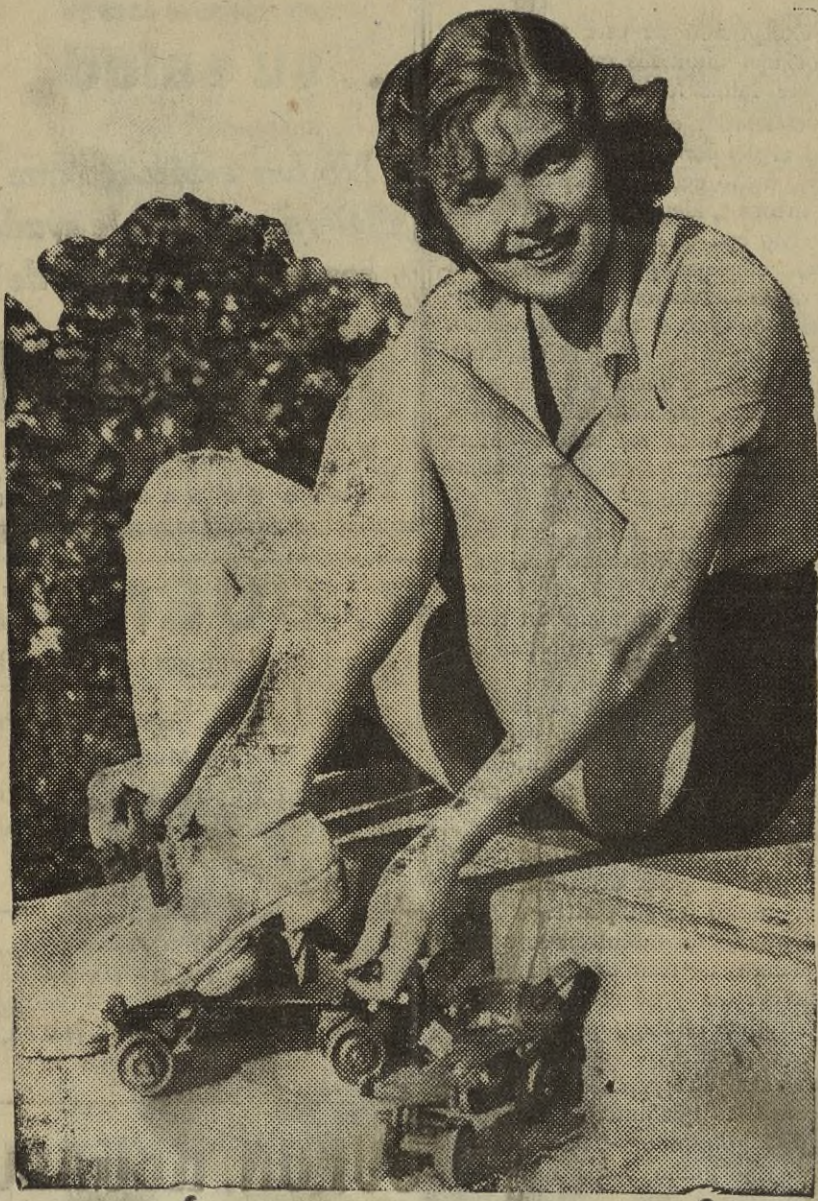
VERNA HILLE, la bella star del cinema ha ganado recientemente el campeonato de patines, en el que tomaron parte numerosas estrellas de Hollywood.