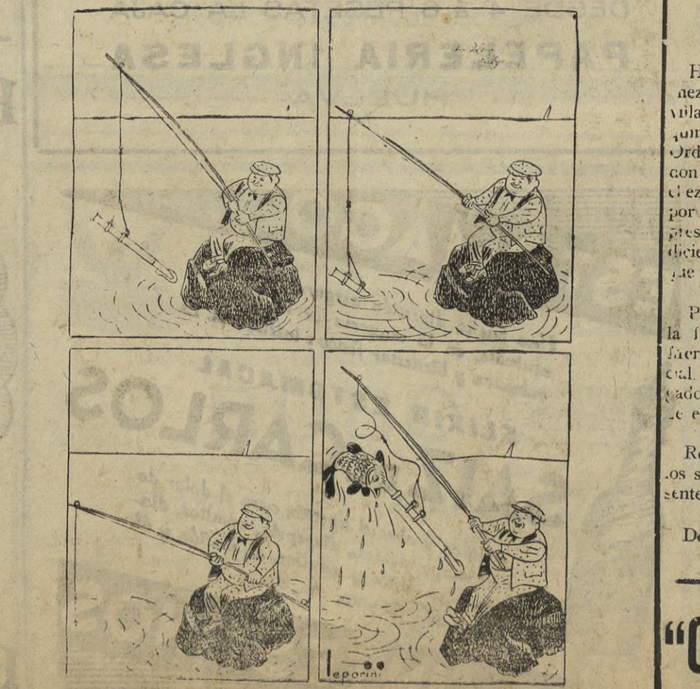
El pescador de pez espada.—El aparejo.