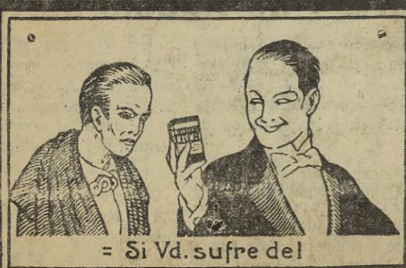
= Si Ud. sufre del