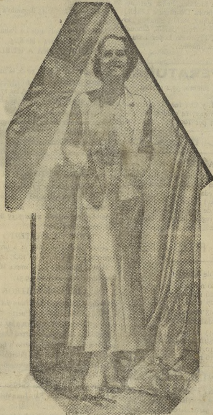
La actriz, Norma Shearer que a su condición de notable y prestigiosa artista de la pantalla une la cualidad de ser admirada como modelo de elegancia y distinción social