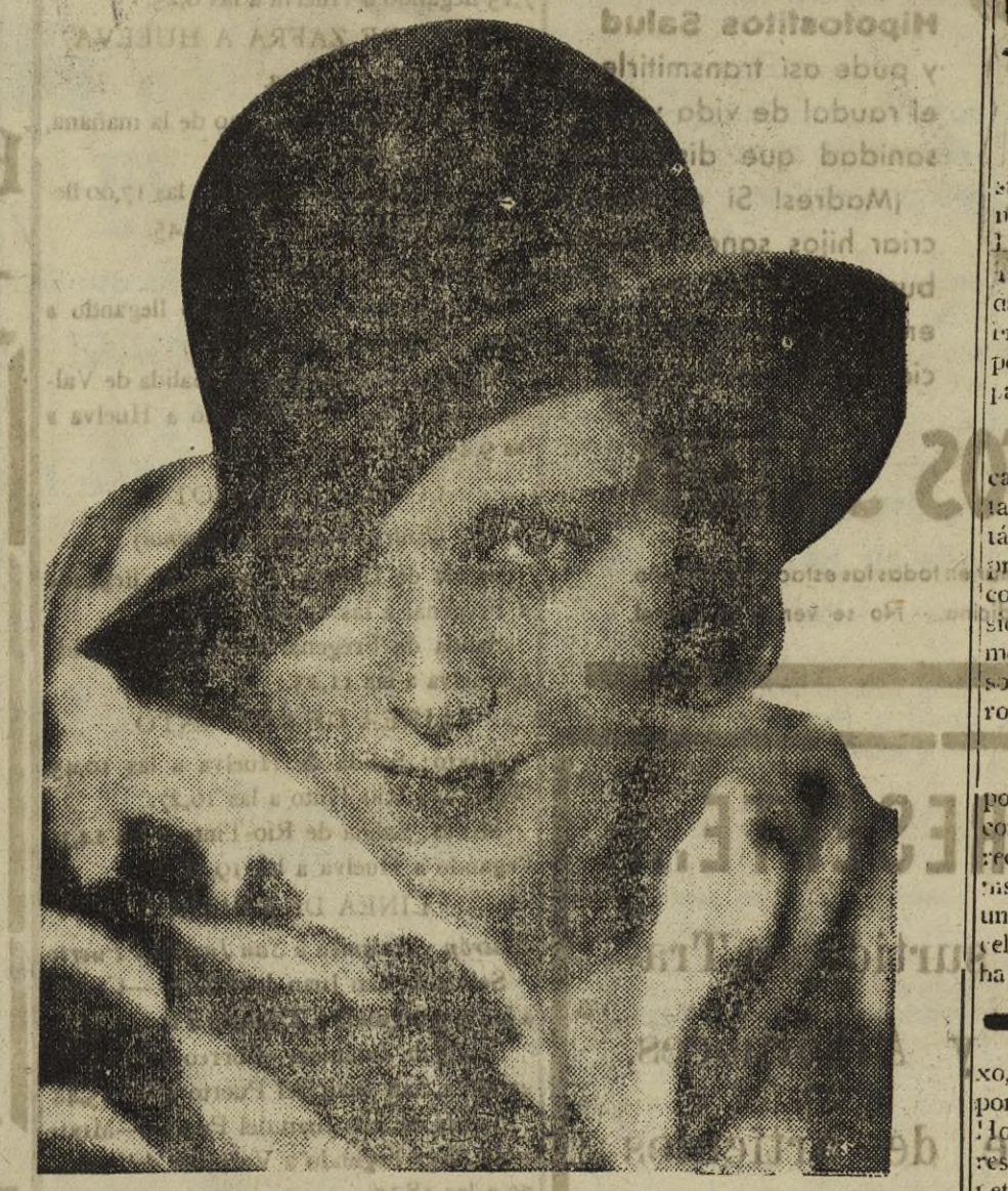
FRANCES DEE, la ballisima actriz de Cinelandia, que une a sus grandes dotes de actriz una espiritual belleza; conjunto de perfecciones que atraen a cuantas la contemplan en el luminoso escenario del lienzo de plota.