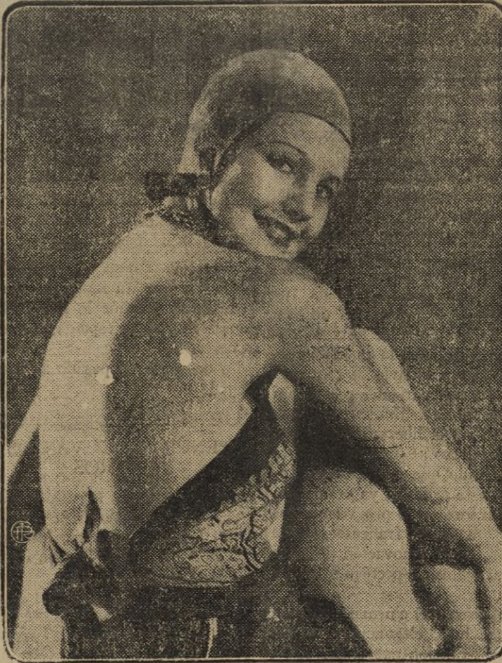
La notable y popularísima peliculara Rochelle Hudson acaba de ganar un campeonato de natación de espaldas; acontecimiento deportivo del que no cabe dudar a la vista de la foto; aunque nos sorprenda la indole del traje poco adecuado para proezas acuáticas. Claro está que el campeonato pudo ser de espaldas, en tierra firme.