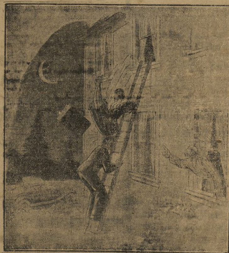
El padre.—¡Ráptela si quiere; pero sin escándalo!

El Gran Hotel Colón anuncia los precios de comidas que rigen en dicho Hotel, que son: desayuno, 4 reales, almuerzo 14 y comidas, 20. Por abono, almuerzo, 12 reales y comida 16, siendo los abonos de diez tarjetas como minimum.