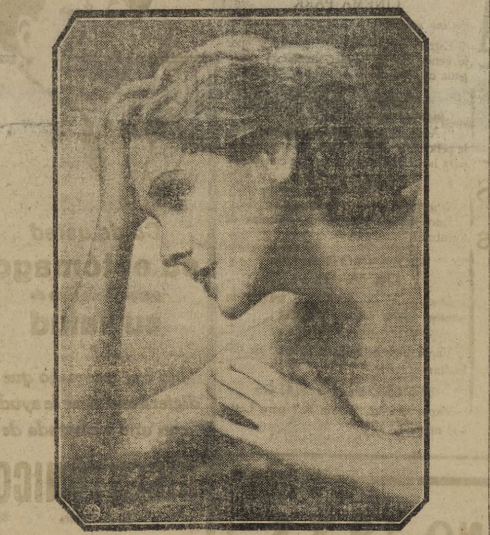
La pequeña irlandesa Maureen O'Sullivan piensa volver a su país, pero parece que no está muy decidida a dejar Hollywood para siempre. ¿Será por esto por lo que está tan preocupada?