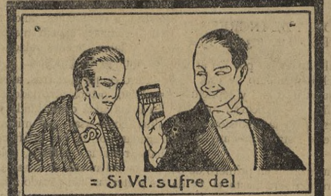
= Si Vd. sufre del

HASTA LAS CHAMPION, SIENDO LAS MEJORES BUJIAS, DEBEN CAMBIARSE CADA 15.000 KMS.