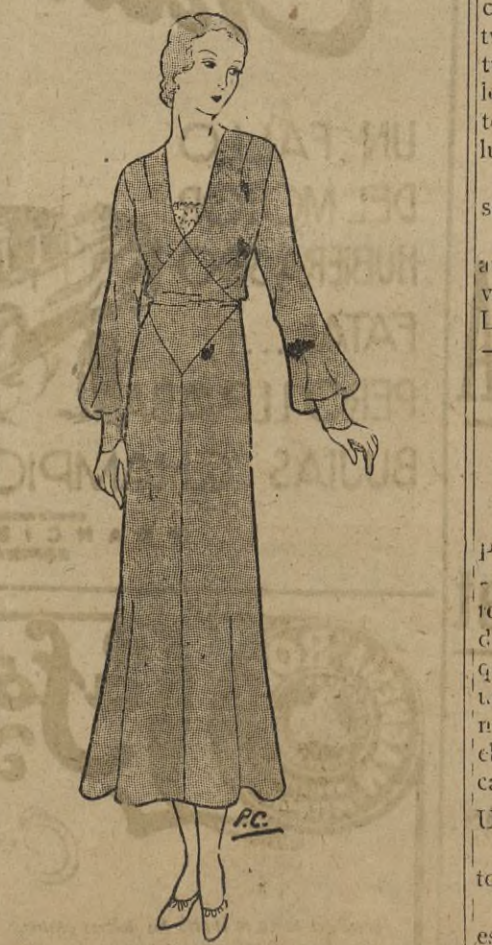
Para dormir es mejor el camisón, más cómodo, siempre que su forma sea graciosa y bonita, lo que se consigue entallándolo y con pliegues a los costados. REGINA

al borde y chaleco azulino, con un kimono calzón negro con anchísima franja azulina largo negro bordado, al estilo de los mantos de Manila en azulina. Las zaparrillas deben ser de raso azulino con bordados negros y tacón negro también