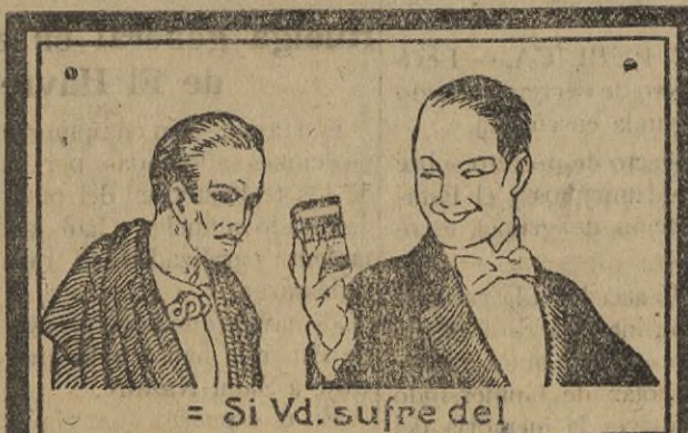
= Si Vd. sufre del

AGENTES DE ADUANA CONSIGNATARIOS DE BUQUES