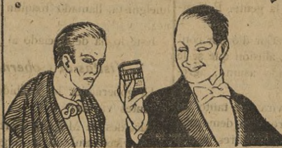
= Si Vd. sufre del

Agentes de Aduanas Consignatarios de Buques Agentes de la Compañía Naviera SOTA Y AZNAR LINEA DE INGLATERRA - Servicios de Cabotaje Apartado 28 Teléfono 1315