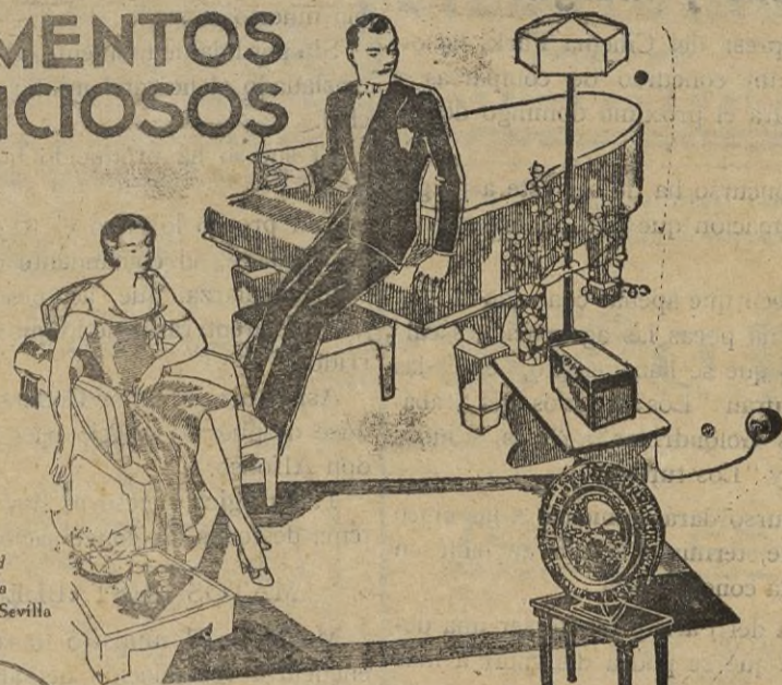
Visto el Stand PHILIPS en la Exposición de Sevilla