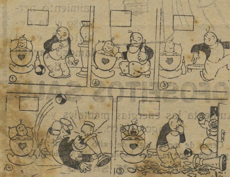
—Duerme, hijo, duerme! (Del "Fliegende Blaetter", de Manfch.)