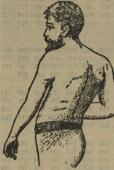
Marca registrada, núm. 28 467