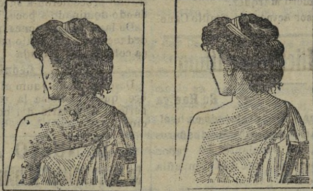
Antes de la Curación. Después de 15 días de tratamiento.

Para todas las Enfermedades de la PIEL, LLAGAS de las PIERNAS, ARTRITISMO REUMATISMO, GOTA, DOLORES, etc. etc.