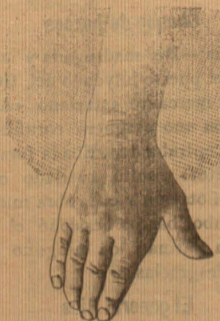
Después de 15 días de tratamientos.