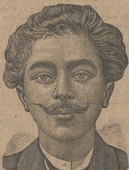
Después de 15 días de tratamientos.