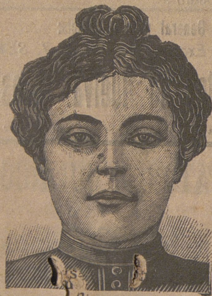
Después de 13 días de tratamiento.