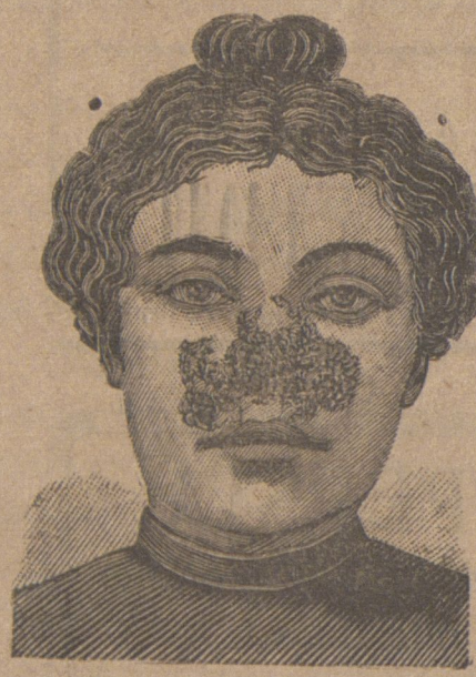
Antes de la curación.

Descubrimiento sensacional. Curación de las enfermedades de la piel y también de las llagas de las piernas.