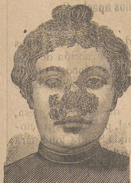
Antes de la curación.

Descubrimiento sensacional. Curación de las enfermedades de la piel y también de las llagas de las piernas