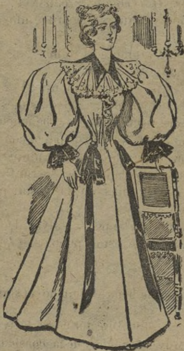
«Rebe», de interior (1)

Jamás triunfará el intento de algunas señoras extravagantes, que según dicen algunos periódicos, se proponen acabar con la moda. En todos tiempos habrá mujeres elegantes, que por perfección de su cuerpo, ó por distinción exquisita, impondrán á las demás sus hábitos ó caprichos, constituyendo así lo que se llama la moda.